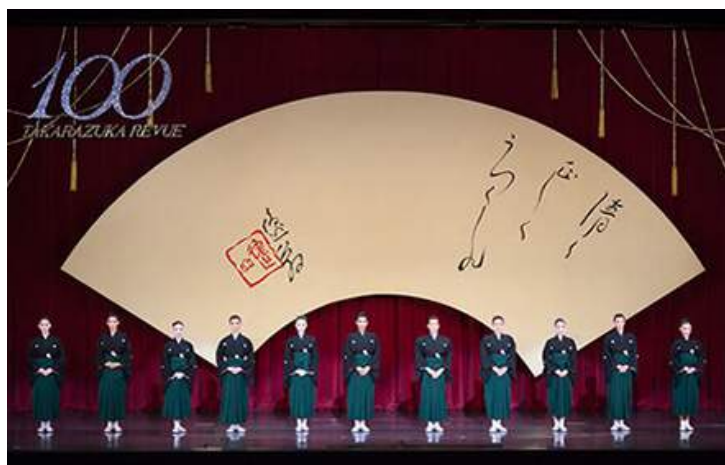
寶塚歌舞劇100周年紀念致詞 (2014年)