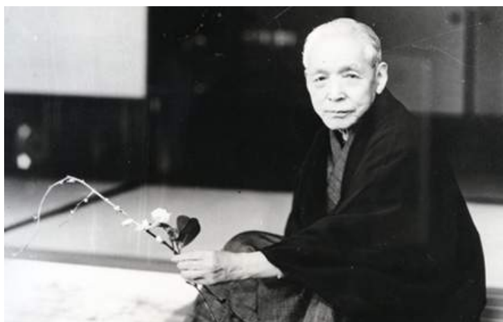
寶塚歌舞劇之父小林一三先生

寶塚歌舞劇的座右銘「清純、正直、美麗」是小林一三先生的教誨。小林先生以創辦「適合闔家觀賞的國民劇」為目標，留下這句教誨，期許少女們不只要鑽研基本的演藝技能，還要注重禮儀與規範，不忘身為一位女性及社會人士應有的品格。不論時代如何變遷，這項精神皆深植於所有寶塚少女、所有工作人員的心底。