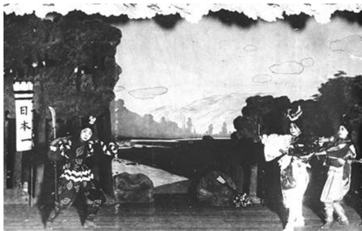
歌舞劇「桃太郎 (ドンブラコ)」劇照