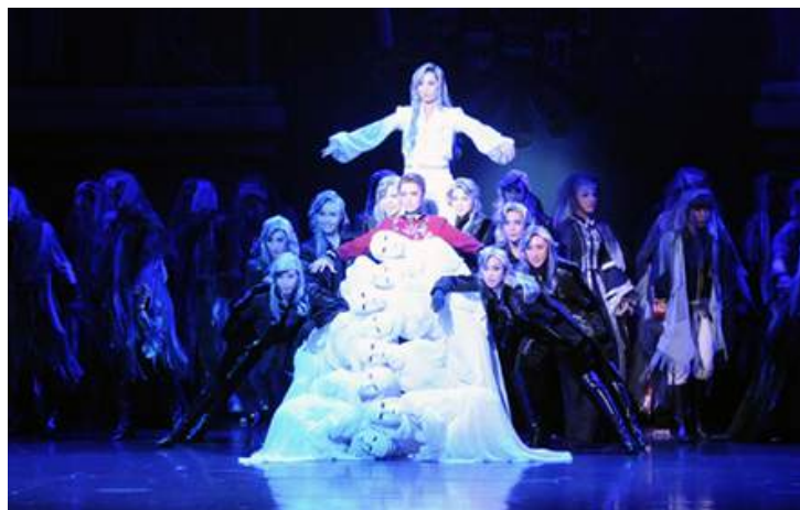
花組公演『伊麗莎白 - 愛與死的輪舞 - 』(2014年)