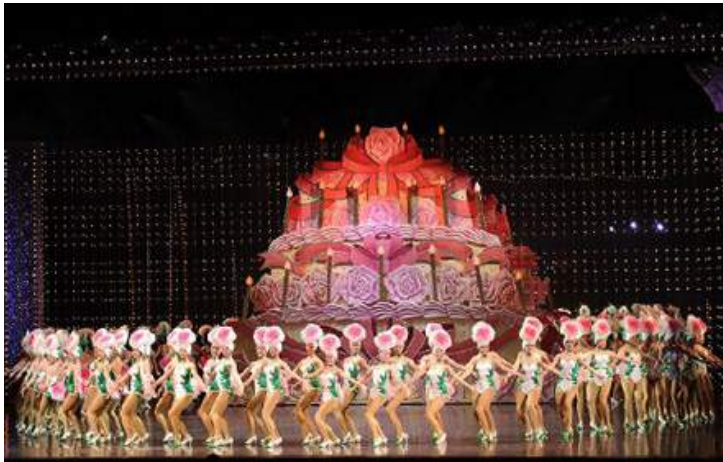
月組公演『TAKARAZUKA 花詩集100!!』(2014年)

由首席組合表演的「雙人舞(Duet Dance)」，數十人成列表演整齊踢腿的「排舞(Line Dance)」，以及所有明星依序走下大階梯進行謝幕的「Parade」等，充滿了寶塚歌舞劇的特色。像這樣定期上演歌舞秀的劇團，綜觀全世界也只有寶塚歌舞劇。