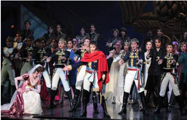
星組公演『不眠之男・拿破崙-愛與榮光之涯-』（2014年）

寶塚歌舞劇吸引多數劇迷的理由之一，就是因為寶塚歌舞劇是只由女性來呈現的世界。清純可愛的娘役配上風流俊俏的男役。尤其是令人感覺比真正的男性還「帥氣」的男役所擁有的存在感，是寶塚歌舞劇的獨特之處。於觀劇時，請試著注意表情、舉止、穿著上的細節，相信您會漸漸發覺男役的美學和娘役的講究。