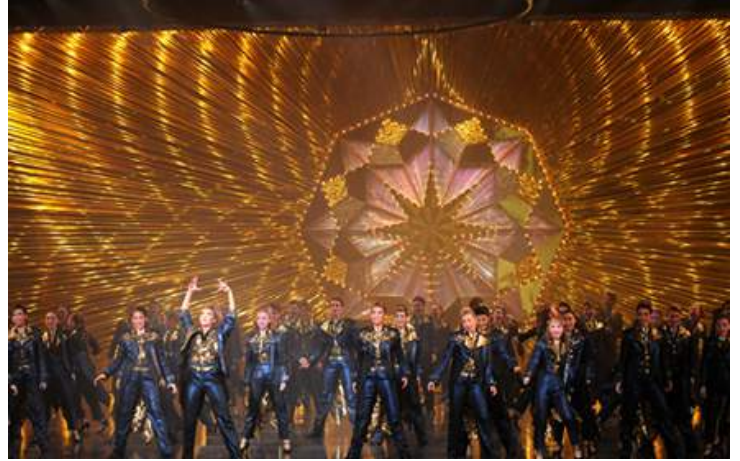
星組公演『Dear DIAMOND!!』- 101克拉的永恆光輝 - (2015年)

由首席組合表演的「雙人舞(Duet Dance)」，數十人成列表演整齊踢腿的「排舞(Line Dance)」，以及所有明星依序走下大階梯進行謝幕的「Parade」等，充滿了寶塚歌舞劇的特色。像這樣定期上演歌舞秀的劇團，綜觀全世界也只有寶塚歌舞劇。