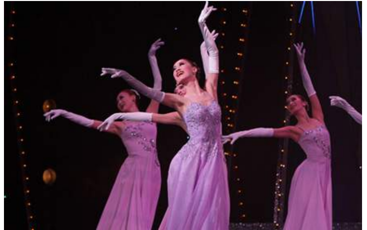
月組公演『CRYSTAL TAKARAZUKA - 印象的結晶 -』（2014年）