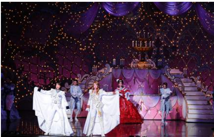
月組公演『凡爾賽玫瑰』- 奧斯卡與安德烈篇 -（2013年）

在舞台與「銀橋」之間設有樂池，所有公演皆為現場演奏。舞台上設有大規模的舞台裝置，例如共有8處或大或小的「昇降舞台（せり）」讓明星從下方升至舞台，還有稱作「盆」的舞台機關，讓舞台中央能如旋轉木馬般旋轉。當最後象徵寶塚歌舞劇的26階大階梯亮起燈飾時更是壓軸。加上穿戴原創的華麗戲服和小道具的明星們充分將寶塚歌舞劇的傳統美學發揮極致，營造出華麗的世界觀，看點十足的夢幻演出就這樣完成了。