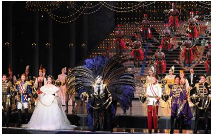
花組公演『伊麗莎白 - 愛與死的輪舞 - 』(2014年)