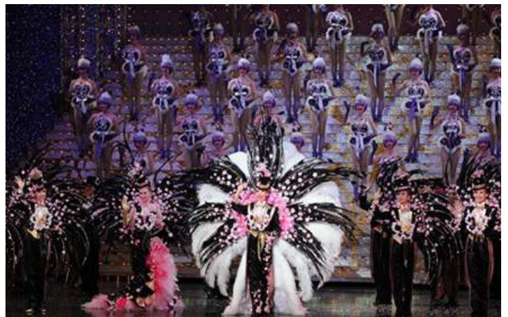
月組公演『TAKARAZUKA 花詩集100!!』（2014年）