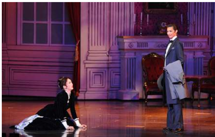
宙組公演『亂世佳人』(2013年)